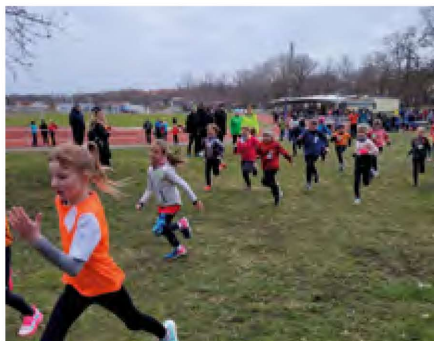
Mädchen der Altersklasse W9